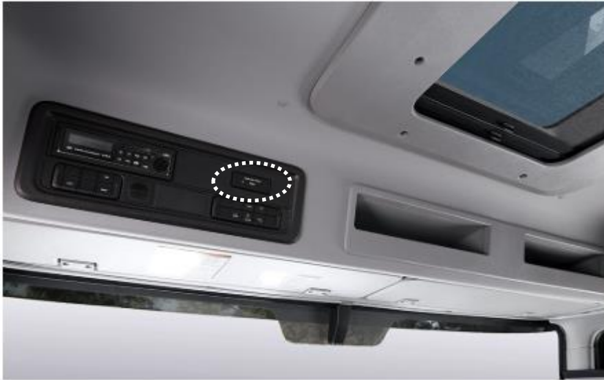
오버헤드 콘솔(표준캡 이미지)